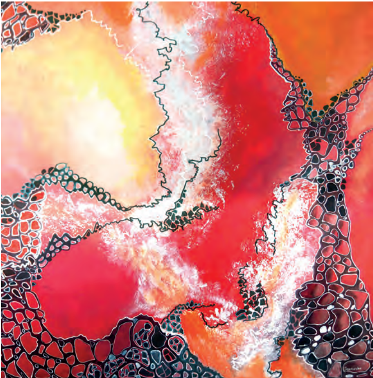
Jeanwehr | énergie | 80/80

D'autres accompagnent l'œil au cœur de paysages éclatés. Des multiples variations de gris émergent des éclaircies. Comme un appel vers des moments plus légers ?