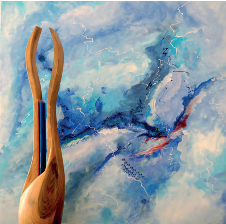
Jeanwehr | Richard Rohart

vernissage jeudi 2 juin 2022 | 16h – 20h